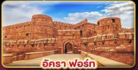
อัครา ฟอรััน