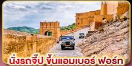
มั้งกรจีป ซันแอมเบอร์ ฟอรััน