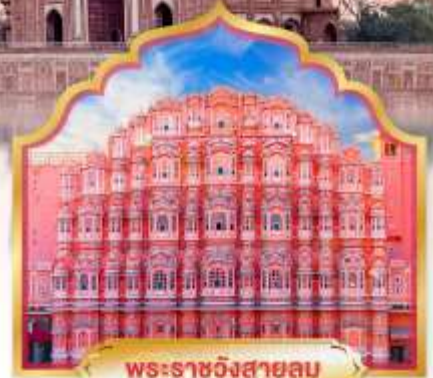
พระราชวังสายลม