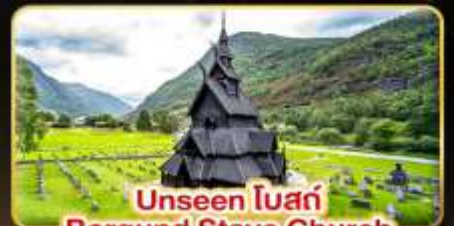
Unseen โบสถ์ Borgund Stave Church