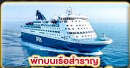
พักบนเรือสำราญ แบบ Window Room 1 คืน