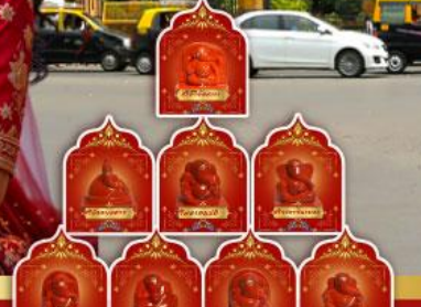
พระพิฆเนศ 8 องค์ เมืองปูणे