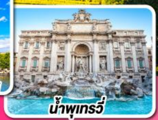
น้ำพุทรวัว