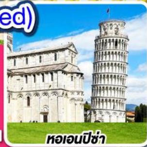
หอนอนปิซ่า