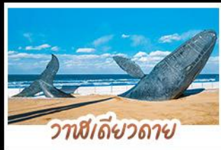
วาฬยัดขวดดาช