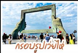
กรอบรูปเว่ยไห่

ทำรูปย่านเมืองเก่าสไตลียอร์มัน • โบสถ์ซันติไมเคิล และย่านป่าดึกทวน พร้อมทัวร์พิพิธภัณฑ์โรงเบียร์ชิงเต่าระดับตำนาน ฟรี! ซิมเนียร์สดท่านละ 1 แก้ว เช็คอินมณฑลมหาสมุทรแปซิฟิก-ทัศนียภาพเพลิงสายฟ้าที่ 8 • แวะทำรูปสุดอาร์ตกับ ซากเรือลู่เว่ย • ตกค่ำดูของกันที่ตลาดสไตลียอร์มัน ถนนอันลือเลื่อง เที่ยวอิสระ-ตามใจชอบ จัดสรรเวลาให้ท่านด้วยวัน FREE DAY 1 วันเต็มในชิงเต่า