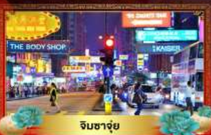
จิมซาจู้