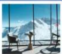
4860 COFFEE SHOP