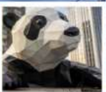
ห้าง IFS หมีแพนด้าเป็นตึก