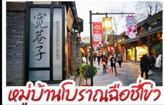
หมู่บ้านโบราณฉือซีไห่