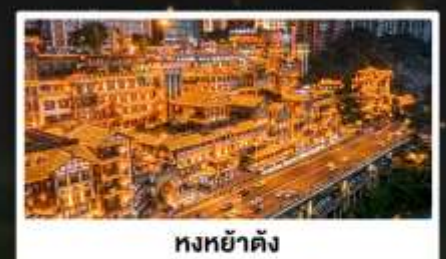
หงหย่าตัง