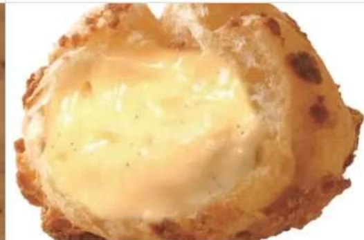
Gourmet Beard Papa 1F[1029]