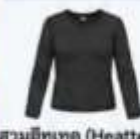
สวมฮีทเทค (Heattech) แบบหนาพิเศษด้านใน