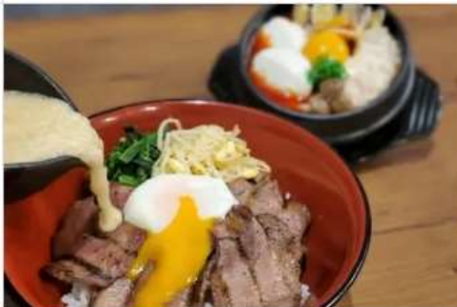
Gourmet MUGITORO & HAN 1F[1081]