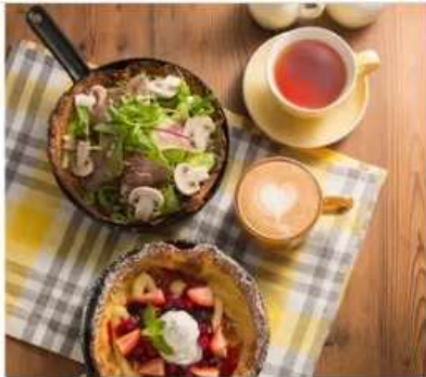
Gourmet Grace Garden Nature Grace Garden 1F[1095]