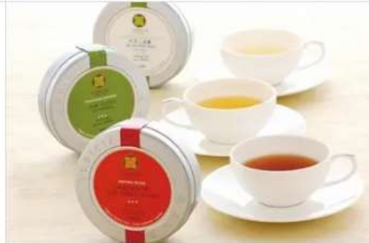
Gourmet LUPICIA LUPICIA 1F[1026]