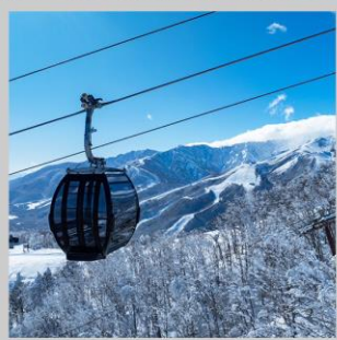
“HAKUBA IWATAKE GONDOLA”