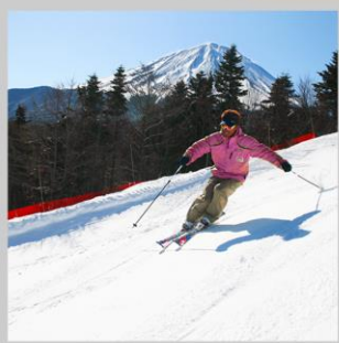
“FUJITEN SNOW PARK”