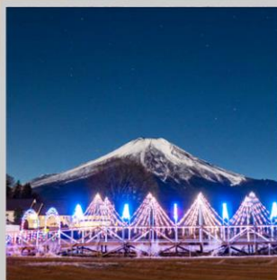
“YAMANAKAKO ILLUMINATION FANTASEUM”