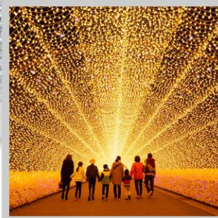
“NABANA NO SATO”