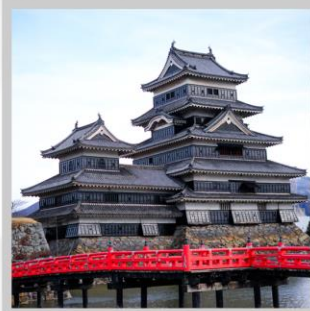
“MATSUMOTO CASTLE PARK”

สัมผัสความงดงามด้านนอก “ปราสาทมัตสึโมโตะ” ที่ตั้งตระหง่านท่ามกลางฉากหลังของเทือกเขาแอลป์ตอนเหนือ เปลี่ยนอิริยาบถ “ส่องเรือชมหุบเขาอะนะเคียว” ชมความงดงามธรรมชาติ ต้นไม้ หน้าผา และสะพานแดงอันโด่งดัง ตื่นตากับการประดับไฟกว่า 5 แสนดวง กับงาน “YAMANAKAKO ILLUMINATION FANTASEUM” ริมทะเลสาบยามานากะ สนุกสนานกับการเล่นหิมะ ในกิจกรรมต่างๆ ณ “FUJITEN SNOW PARK” พร้อมวิวภูเขาไฟฟูจิเป็นฉากหลัง ตระการตา “เทศกาลประดับไฟฤดูหนาว” ในธีมต่างๆหลากหลายโซน จัดแสดงไฟกว่า 2 ล้านดวงที่ยิ่งใหญ่ติดอันดับ1 ของญี่ปุ่น เปลี่ยนอิริยาบถ “นั่งกระเช้าฮาคุบะ อิวะตะกะะ” เพื่อชมวิวเทือกเขาแอลป์ญี่ปุ่นกับทิวทัศน์ฤดูหนาวแบบพาโนรามา