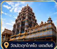
วัดมัตตุกโคกโต เซดเตียร์