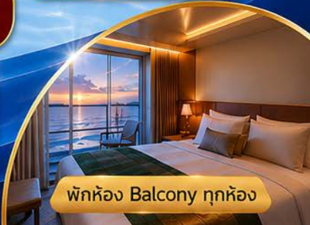
🌟 พักห้อง Balcony ทุกห้อง