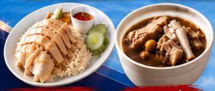
ข้าวมันไก่ปีนัง

🚢 พัก สิงคโปร์ 1 คืน ----- 🚢 บนเรือ 3 คืน