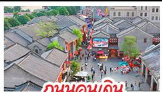
ถนนคนเดินสามนครสองซอย