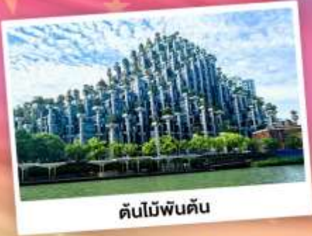
ต้นไม้พันต้น