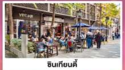
ชิวเกียนตี้