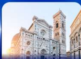
ชมเมืองแห่งศิลปะ ฟลอเรนซ์