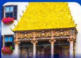
หลังคาทองคำ อินส์บรุค