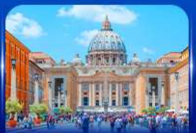
นครรัฐวาติกัน โรม