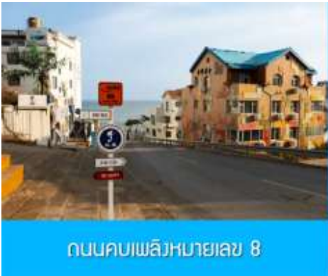
ถนนคบเพลิงหมายเลข 8

นำท่านจิบไวน์ในปราสาทสไตล์ยุโรป หลีกหนีความวุ่นวายและก้าวเข้าสู่ดินแดนที่ราวกับหลุดมาจากเทพนิยายยุโรป ณ ไร่ไวน์ ชาโตว์ ณ คฤหาสน์ งามอยู่ ปราสาทไวน์อัน โอ่อ่าที่ตั้งตระหง่านกลาง ไร่องุ่นสุดลูกหูลูกตาในเมืองเยียนไถ มณฑลซานตง ที่นี่คือการบรรจบกันอย่างลงตัวของมรดกการผลิตไวน์กว่าร้อยปีของจีนและความเชี่ยวชาญจากฝรั่งเศส ทำให้เกิดเป็นแหล่งท่องเที่ยวที่ไม่เพียงสวยงามน่าถ่ายรูป แต่ยังเป็นสวรรค์ของคนรักไวน์ นำท่านเดินชมสถาปัตยกรรมคลาสสิก เยี่ยมชมห้องเก็บไวน์ใต้ดินอันลึกลับ และปิดท้ายด้วยการชิมไวน์รสเลิศที่ผลิตจากองุ่นในไร่แห่งนี้ เสริมแต่งประสบการณ์ที่จะทำให้การเดินทางของคุณพิเศษยิ่งขึ้น ปิดท้ายประสบการณ์อันสุดแสนคลาสสิกนี้... ด้วยการ ลิ้มรสไวน์แดง (ท่านละ 1 แก้ว) ที่มีชื่อเสียงของที่นี่, จากนั้น นำท่านเดินทางสู่ เมืองเวย์ไห้ 威海 ตั้งอยู่ปลายสุดของคาบสมุทรซานตง ซึ่งเป็นเมืองท่าสำคัญที่มีชายฝั่งทะเลสวยงามสะอาด อากาศเย็นสบายในฤดูร้อนและมีหิมะตกหนักในฤดูหนาว ได้รับอิทธิพลวัฒนธรรมเกาหลีได้เนื่องจากที่ตั้งใกล้ที่สุด จุดเด่นคือเกาะหลิวกง เมืองหัวเซี่ยเฉิง และบรรยากาศเมืองท่าที่พักผ่อนสบาย นำท่านเก็บบรรยากาศกับ กรอบรูปวิวทะเล อีกหนึ่งไฮไลท์สุดฮิตที่มาเวย์ไห้ ต้องถ่ายรูปกับจุดนี้