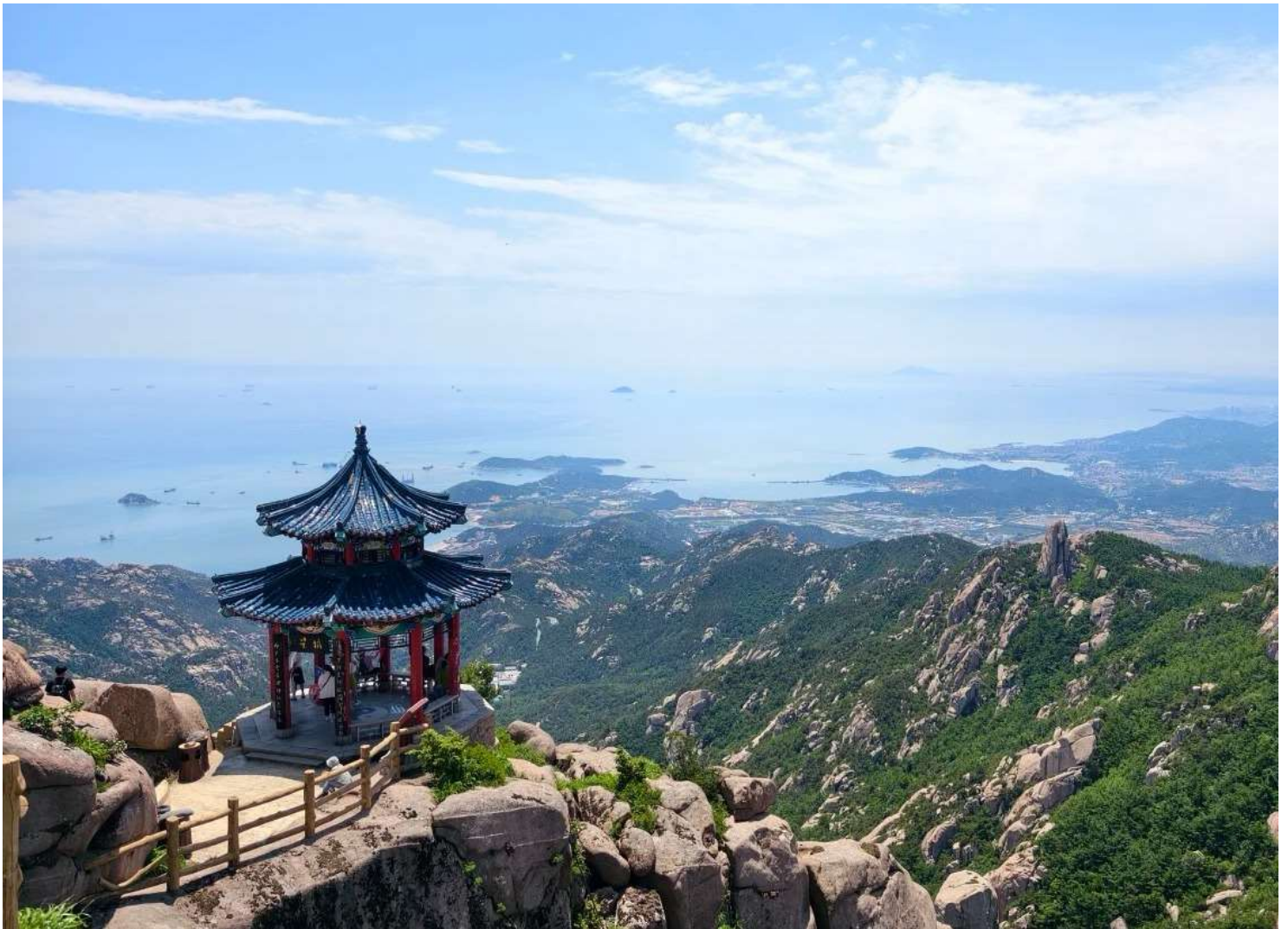
สูงประกอบด้วยจุดท่องเที่ยวหลักหลายแห่ง (ราคานี้รวมค่ารถอุทยานแล้วเที่ยวดำหนักไต้ซิงกง)

นำท่านสู่ ภูเขาเหลาซาน สัมผัสพลังแห่งขุนเขาศักดิ์สิทธิ์ แหล่งท่องเที่ยวระดับ 5A เมืองซิงเต่า มณฑลซานตงภูเขาศักดิ์สิทธิ์แห่งลัทธิเต๋า ที่ผสมผสานธรรมชาติและศาสนาได้อย่างลงตัวมี นอกจากนี้ภูเขาเหลาซานยังเป็นที่ตั้งของวัดและศาลเจ้าประวัติศาสตร์หลายแห่งที่สะท้อนวัฒนธรรม และความเชื่อแบบจีนดั้งเดิม อีกทั้งภูเขาแห่งนี้ปรากฏในตำนานและวรรณกรรมจีนหลายเรื่อง เช่น มีเรื่องเล่าว่าจักรพรรดิฉินสื่อหวง และจักรพรรดิฮั่นอู่ เคยเสด็จมาที่นี่เพื่อ แสวงหาความเป็นอมตะจากเซียน จุดเด่นอีกอย่างของภูเขาเหลาซาน คือ วิวทะเลที่มองเห็นได้จากยอดเขา ท่านจะได้ชมวิวแบบสวยงามของห้องทะเลจากมุม