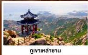
ภูเขาเหลาชาน