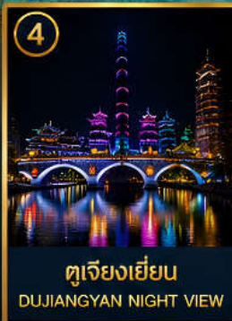
4 ตูเจียงเยียน DUJIANGYAN NIGHT VIEW