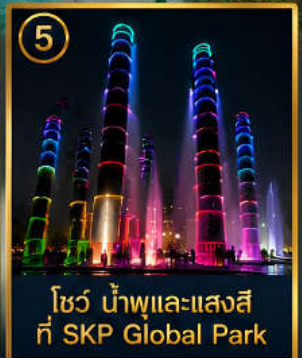
5 โชว์ น้ำพุและแสงสี ที่ SKP Global Park