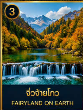
3 จิวจ้ายโกว FAIRYLAND ON EARTH