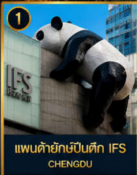
1 แพนด้ายักษ์ป็นตึก IFS CHENGDU