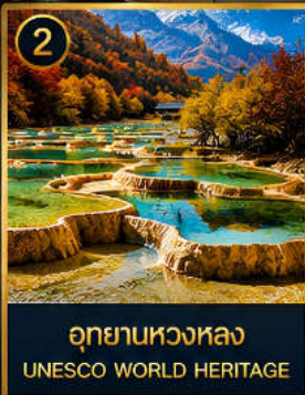
2 อุทยานหวงหลง UNESCO WORLD HERITAGE