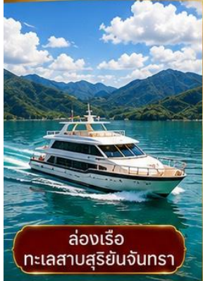
ล่องเรือ ทะเลสาบสุริยจันทรา