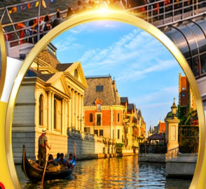
Venice Water City