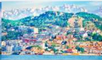
หมู่บ้านชาวประมงซาจื่อโข่ว