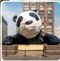
หมีแพนด้ายักษ์ป็นตึก