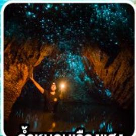
ถ้ำทอนเรืองแสง ไวโตโม