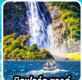
บิลฟอร์ด ซาวด์ นั่งเรือชมความงาม ฟยอร์ด