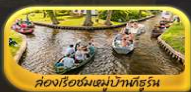
ล่องเรือชมหมู่บ้านกังหัน