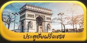
ประตูชัยฝรั่งเศส

พิเศษ!! ล่องเรือแม่น้ำเซนชมเมือง โดย บาโด มุช