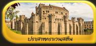
ปราสาทราเวนสตัน