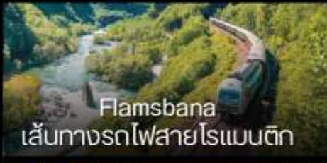
Flamsbana เส้นทางรถไฟสายโรแมนติก