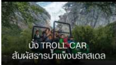
นั่ง TROLL CAR สัมผัสธารน้ำแข็งบรึกสเด