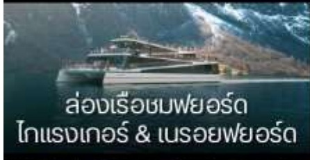
ล่องเรือชมฟยอร์ด โทแรงเกอร์ & นรอยฟยอร์ด