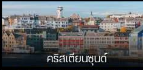
คริสเตียนซุนด์