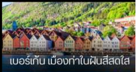
เบอร์เก้น เมืองท่าในฟินส์สไต