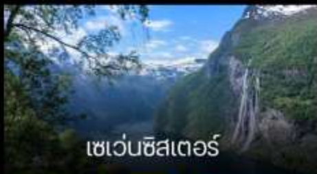
เซเว่นซิสเตอร์