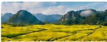
พิก TONG CE HOTEL เทียบเท่า 4 ดาว Local