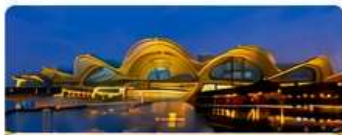
พิก FEI XING HOTEL เทียบเท่า 4 ดาว Local