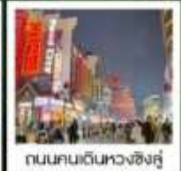
ถนนคนเดินหวงชิ่งคู่