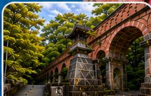
วัดนินเซ็นจิ เกียวโต