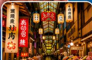
ตลาดนานิชิกิ เกียวโต