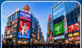
ช้อปปิ้งย่านชินไซบาชิ โอซาก้า