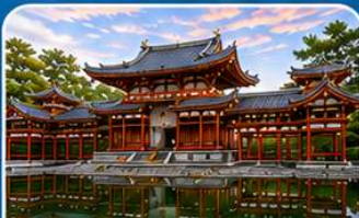
วัดเบียวโดอิน เมืองอุจิ