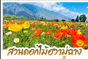
สวนดอกไม้ฮวามู่ฉาง