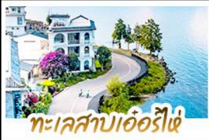
ทะเลสาบเอ๋อร์ไห่