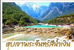
เขาสวนธาระจันทรสีน้ำเงิน