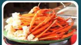
ชาบูบุฟเฟ่ต์