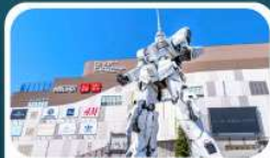
ห้างไดเวอร์ซิตี