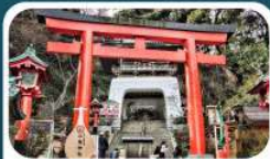
ศาลเจ้าอินะชิมะ