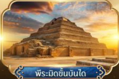
พีระมิดขั้นบันได