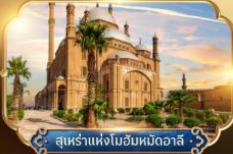
สุเหร่าแห่งโมฮัมหมัดอาลี