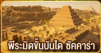
พีระมิดขั้นบันได ชิคคาร์่า