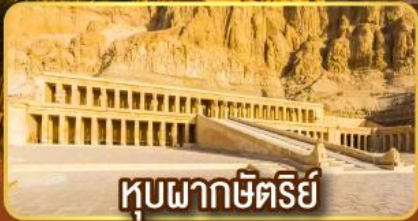
หุบผากษัตริย์