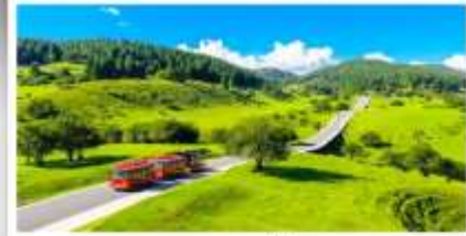
เวนางฟ้า

เดินทางโดย: สายการบินดงซิ่งเจียงเป่ย์ (PN)