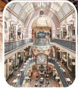
QUEEN VICTORIA BUILDING