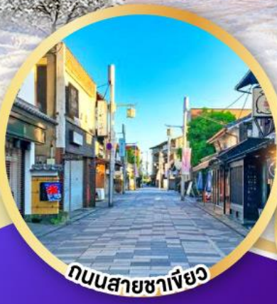
ถนนสายชาเขียว