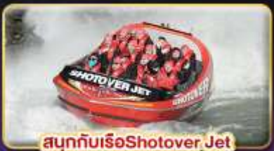
สนุกกับเรือ Shotover Jet