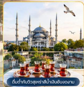
ต้นตากับวิวกาโบรามา 360° บนชั้นดาดฟ้า

พิเศษ...สุดๆ! นำท่าน ขึ้นสู่จุดเช็คอินแห่งใหม่ Seven Hills Café ซึ่งเป็นสถานที่ยอดนิยมขณะนี้...บนชั้นดาดฟ้า ของโรงแรมเซเวนฮิลล์ส ท่านจะได้ถ่ายรูปกับวิวมุมต่าง ๆ ช่องแคบบอสฟอรัส, สุเหร่าสีน้ำเงินและสุเหร่าฮาเจียโซเฟีย พร้อม ให้อาหาร กับเหล่าพนักงานนวลที่จะบินมารับอาหารจากท่าน **ขออนุญาตท่านที่ชื่นชมความงามวิวกาโบรามา 360° สุดตระการตา