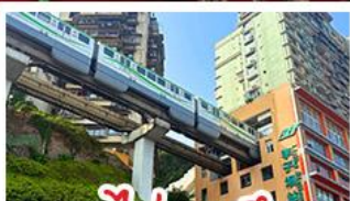
รถไฟทะลุคด