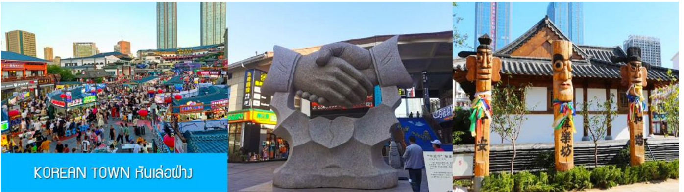
KOREAN TOWN หันเล่อฝาง

จากนั้นนำท่านสู่ ย่านเกาหลี KOREAN TOWN หันเล่อฝาง 韩乐坊 แหล่งท่องเที่ยวระดับ 3A ที่ชุกชุมเต็มไปด้วยวัฒนธรรมเกาหลีของเมืองเว이하ี ประกอบด้วยถนนคนเดินเกาหลี ประตุน้ำที่สวย หอเฉลิมฉลอง และจัตุรัสวัฒนธรรมเล่อเทียนที่มีความโดดเด่นด้านสถาปัตยกรรม ให้ท่านได้เดินชม เก็บภาพ ลิ้มรสอาหารพื้นเมืองในย่านเกาหลีได้อย่างเต็มอิ่ม..