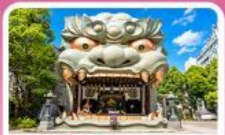
ศาลเจ้านิมมะ ยาชากะ