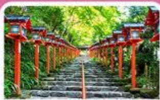
ศาลเจ้าคิฟูเนะ