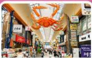
ตลาดคูโรมง