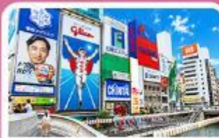
ชิบโซบาชิ