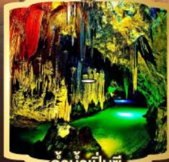
ถ้ำน้ำเป็นซี