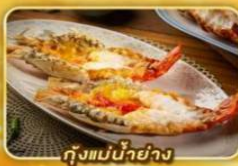
กุ้งแม่น้ำย่าง