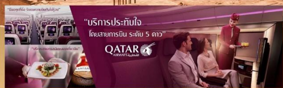
"บริการประทับใจ โดยสายการบิน ระดับ 5 ดาว"