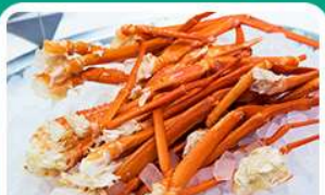
พิเศษ! บุฟเฟ่ต์ขาปู