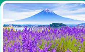
สวนโออิชิปาร์ค