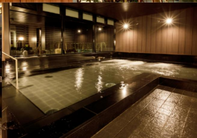
Large Public Bath