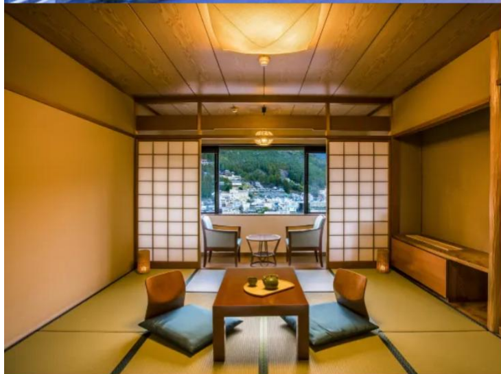
Standard Japanese-style Room 49.5m