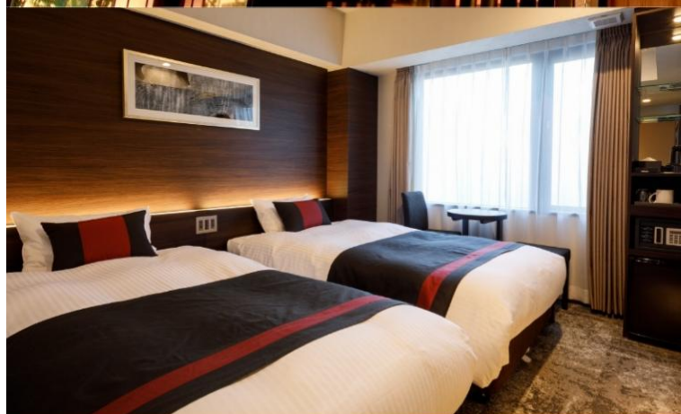
Standard Twin Room 16-17 sqm