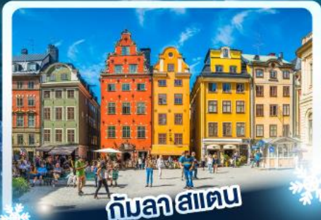
🏡 กับลาสแตน