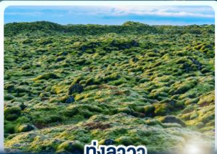
🌿 ทุ่งลาวา