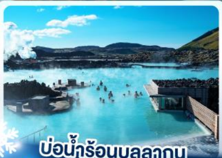
♨️ แช่น้ำร้อนบลูลากูน

เก็บไอซ์แลนด์ แดนภูเขาไฟคิร่าจูลา และ แช่น้ำร้อนบลูลากูน