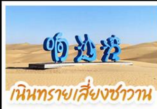
เนินทรายเสียงซาวาน