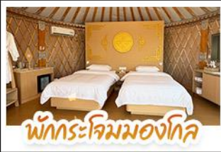
พักโรงแรมมองโกเลีย

เที่ยวสบาย นอนหรูระดับ 5 ดาว เปลี่ยนลุคเป็นสาวมองโกเลียสุดชิค! ทริปนี้จัดให้แบบ V.I.P. เปิดประสบการณ์ พักโรงแรมมองโกเลียสุดพรีเมียม พร้อมนั่งกระเช้าและขี่อูฐไปตะลุยเนินทรายเสียงซาวาน เก็บครบทั้งไฮโซดและสุสานเจกิสถาน