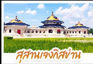
สุสานเจกิสถาน