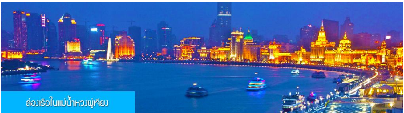
ล่องเรือในแม่น้ำหวงผู่เจียง