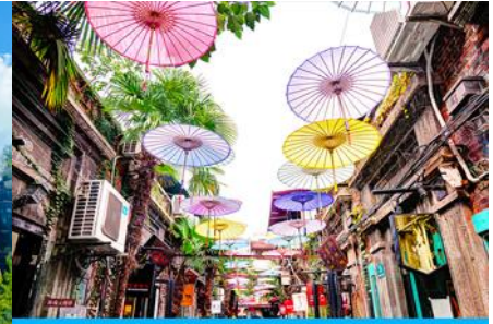
ย่านเกียบจิวฟา