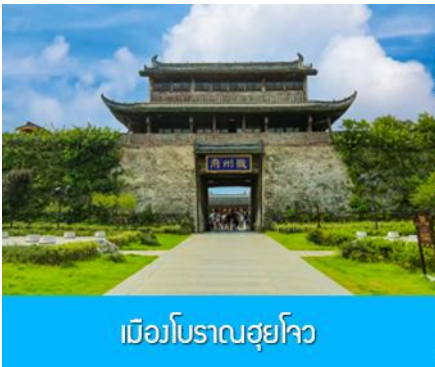
เมืองโบราณฮุยโจว

เช้า รับประทานอาหารเช้า ณ ห้องอาหารของโรงแรม (1)