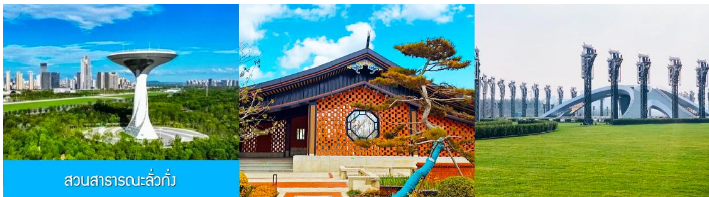
สวนสาธารณะลั่วกั๋ว

เช้า รับประทานอาหารเช้า ณ ห้องอาหารของโรงแรม (8)