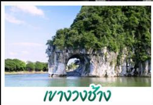
เขาวงกตช้าง