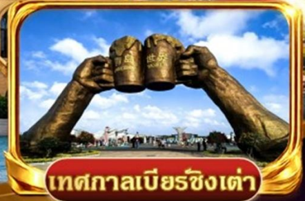
เทศกาลเบียร์ชิงเต่า