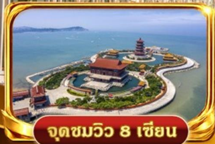
จุดชมวิว 8 เชียง